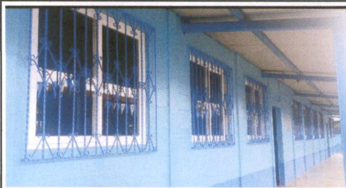
Foto 2: MÓDULO 2 AULAS VENTANAS: Sustitución de estructura de metal de ventana, Sustitución de balcones de metal