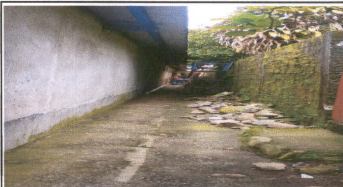
Foto 4: MÓDULO 2 REPARACION DE REPELLO Y CERNIDO DE PAREDES: Repello en muro