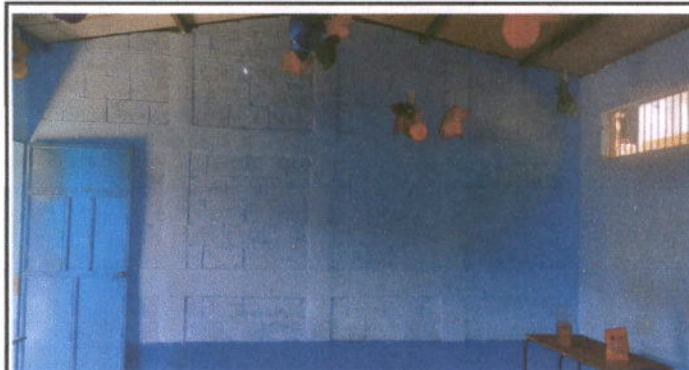
Foto : MÓDULO 2 AULAS MUROS: Reparación de muro perimetral de block