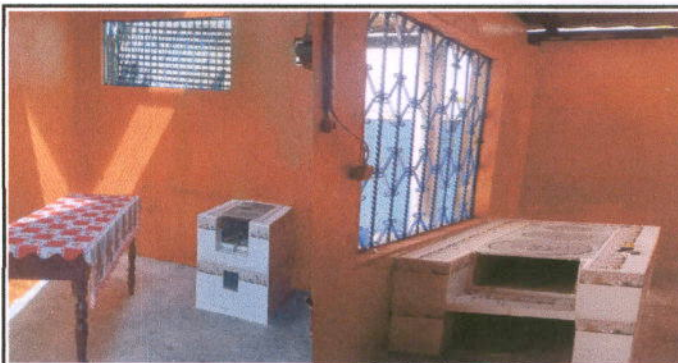
Foto 6: MÓDULO 3 REPARACIÓN DE COCINA: Sustitución de estufa rural (completa) incluye chimenea y plancha de metal.

Observación: Si es necesario se pueden agregar hojas adicionales y actualizar el número de hojas.